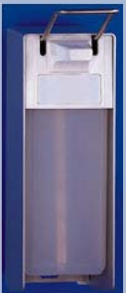
T 25 - a Aluminium eloxiert Inhalt: 1.000 ml Zur Wandmontage geeignet