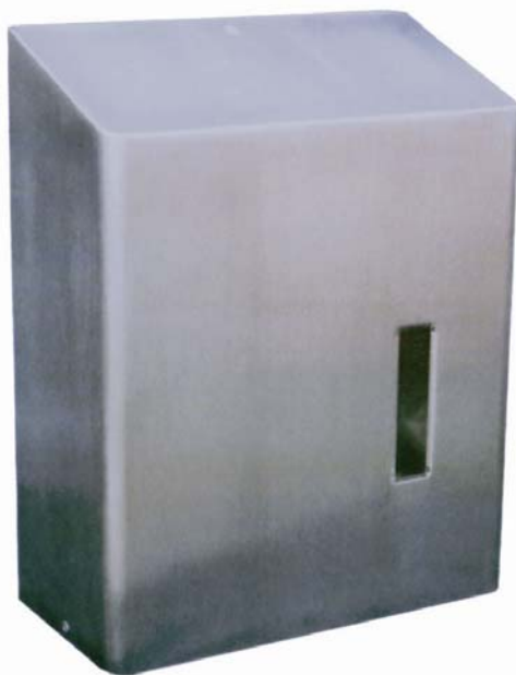
Artikelnummer: HDI 10