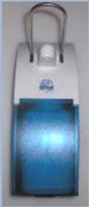
T3-1 gebürstet Inhalt: 500 ml mit Wandhalter