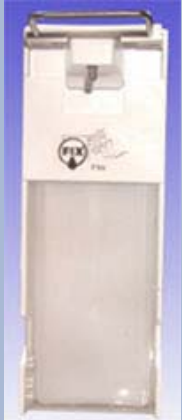
T3-a Kunststoff Kurzer Bedienungshebel Inhalt: 1.000 ml Zur Wandmontage geeignet