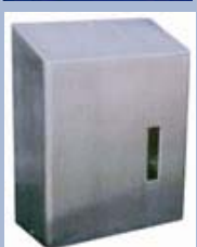
HDI 10 Handdesinfektionsmittelspender Maße (BxHxT): 260 x 315 x 150 mm